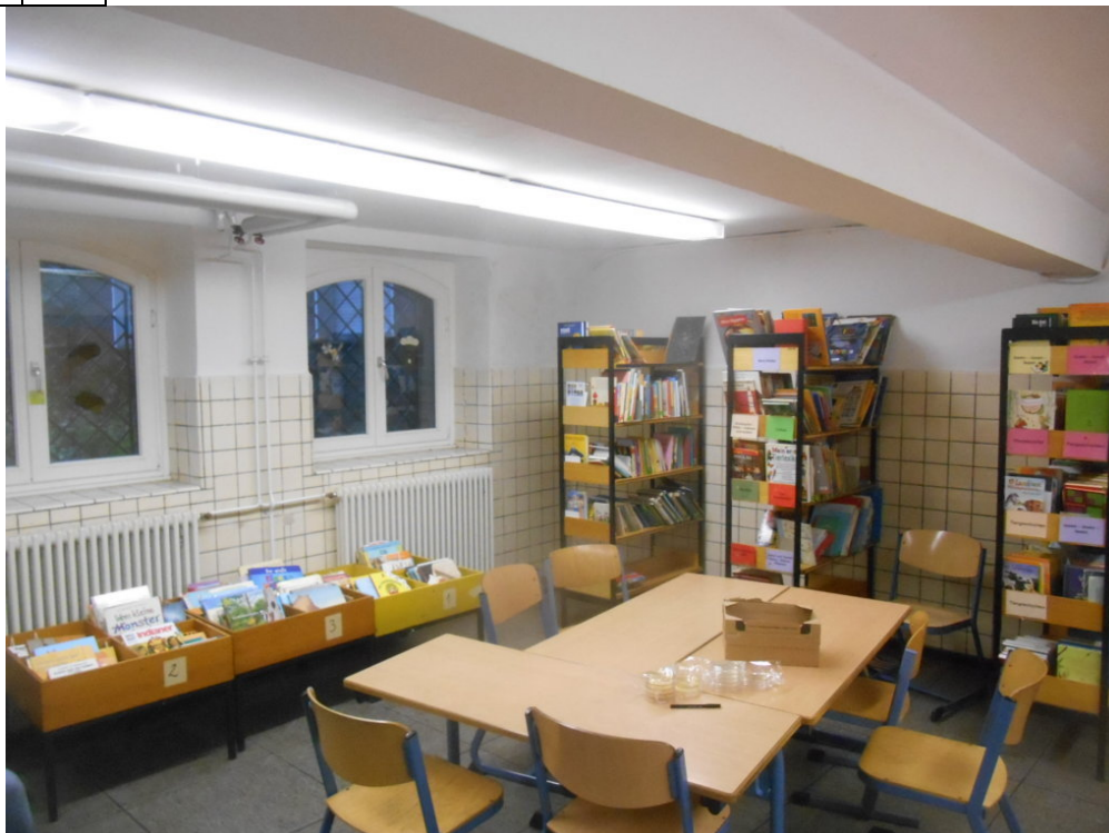
Bild Nr: 4 Fensterleibung in der Betreuung im Untergeschoss – Probe Nr. 381/18 – A1 (OT 14.12.2018)

Bild Nr: 3 Bücherei im Untergeschoss – Probe Nr. 381/18 – L3 (OT 14.12.2018)