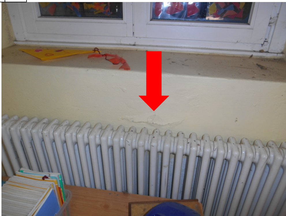
Bild Nr: 6 Wandfläche Fluchttreppe Alte Küche im Untergeschoss – Probe Nr. 381/18 – A3 (OT 14.12.2018)

Bild Nr: 5 Wandfläche Brüstung in der Betreuung im Untergeschoss – Probe Nr. 381/18 – A2 (OT 14.12.2018)