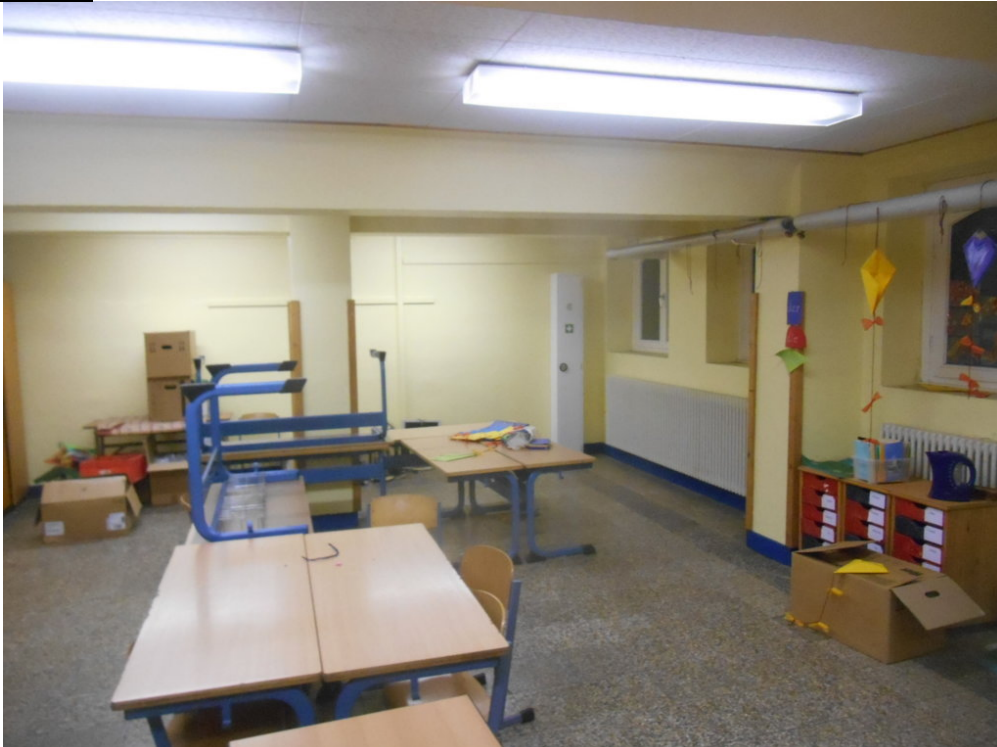
Bild Nr: 2 Alte Küche im Untergeschoss – Probe Nr. 381/18 – L2 (OT 14.12.2018)

Bild Nr: 1 Betreuung im Untergeschoss – Probe Nr. 381/18 – L1 (OT 14.12.2018)