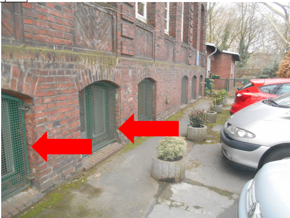
Bild Nr: 10 Wie vor, im Fensteranschlussbereich (OT 14.12.2018)

Bild Nr: 9 Wie vor, mit erkennbaren Schäden (OT 14.12.2018)